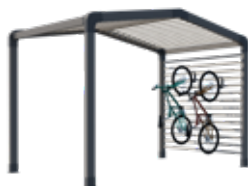
Aparcamiento para bicicletas o almacenamiento