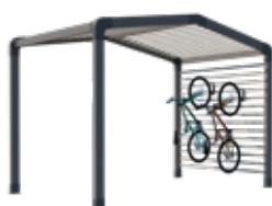
Range-vélos et/ou stockage

Sas d'entrée, espace détente ou de stockage, chambre indépendante, les modul'homes s'adaptent aussi bien aux mobil-homes 1 pente que 2 pentes. Ils peuvent se positionner en pignon, comme un sas ou détachés du mobil-home.