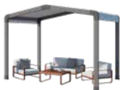
Espace de détente