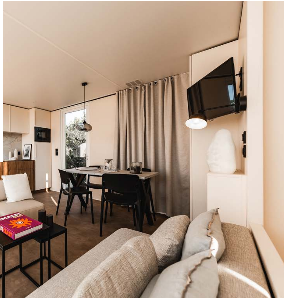
Cocina con microondas integrado opcional

DIMENSIONES: 10,41 x 4,45 m (tejado excluido)